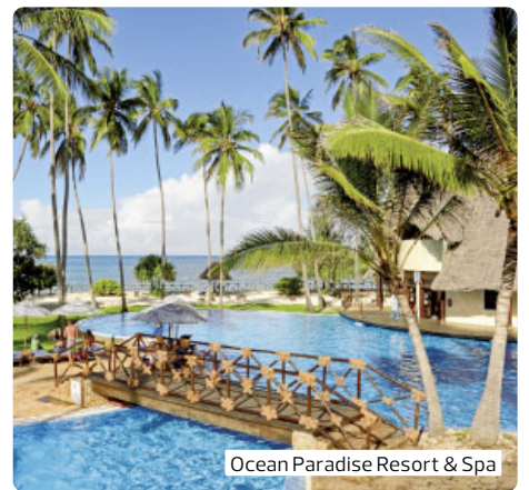
Ocean Paradise Resort & Spa

grenze zwischen Kenia und Tansania. Hier kann man buntes Treiben beobachten. Am heutigen Samstag ist großer Markttag in Taveta, so dass zahlreiche Händler zwischen beiden Ländern pendeln. Grenzübergang, Guide- und Fahrzeugwechsel und Fahrt nach Usa River bei Arusha. Ihre Lodge ist umgeben von Kaffee- und Bananenplantagen. Tourbesprechung im Garten mit Kaffee, Tee und Gebäck. Eine Nacht in der Mount Meru Game Lodge (Landeskategorie: 4 Sterne). Ca. 190 km (F, M, A)