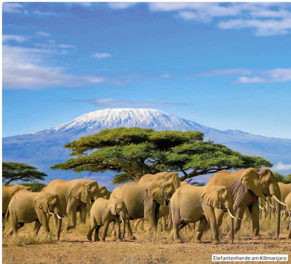
Elefantenherde am Kilimanjaro